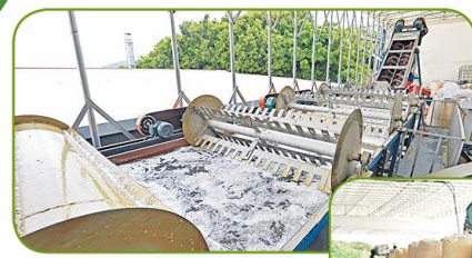
▲俊成環保有限公司新購建的塑膠清洗系統，可以自動分辨PET及HDPE塑膠，大大增加回收效率。

香港特區政府自2015年10月成立回收基金以來，一直以提升回收業界作業能力和效率為目標，令回收業可持續發展，以及促進廢物回收再造，轉化為有用資源及產品。回收基金下設有「企業資助計劃」及「行業支援計劃」，分別向合資格的企業及非分配利潤組織提供資助，最高資助額為1,500萬港元，並特設「標準項目」，令非增長建議書的中小企業更容易獲得資助。而香港生產力促進局為基金的執行夥伴及秘書處，亦全力協助基金籌備、推廣、管理、實行和監察回收基金的活動和項目。截至今年2月底，已批出了341份申請，涉及資助金額約2.8億港元。