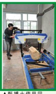
▲甄博士使用回收基金購買的大型鋸木機。