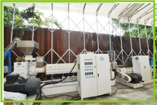
▲後成環保有限公司獲批標準項目，資助購置一套塑膠清洗系統及造膠粒機。