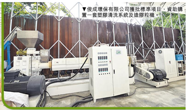
▼俊成環保有限公司獲批標準項目，資助購置一套塑膠清洗系統及造膠粒機。

香港特區政府自2015年10月成立回收基金以來，一直以提升回收業界作業能力和效率為目標，令回收業可持續發展，以及促進廢物回收再造，轉化為有用資源及產品。回收基金下設有「企業資助計劃」及「行業支援計劃」，分別向合資格的企業及非分配利潤組織提供資助，最高資助額為1,500萬港元，並特設「標準項目」，令非增長建議書的中小企業更容易獲得資助。而香港生產力促進局為基金的執行夥伴及秘書處，亦全力協助基金籌備、推廣、管理、實行和監察回收基金的活動和項目。截至今年2月底，已批出了341份申請，涉及資助金額約2.8億港元。