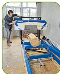
▲甄博士使用回收基金購置的大型鋸木機。