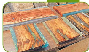
▲甄博士將本地廢木結合環氧樹脂製成的家具，充滿藝術感。

回收基金全年接受申請： 網址： www.recyclingfund.hk 查詢： +852 2788 5658