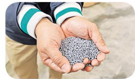
▼在本地回收的塑膠，經處理後就可變成可再造的塑膠粒。