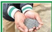
▲在本地回收的塑膠，經處理後就可變成可再造的塑膠粒。