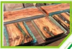
▲甄博士將本地廢木結合環氧樹脂製成的家具，充滿藝術感。