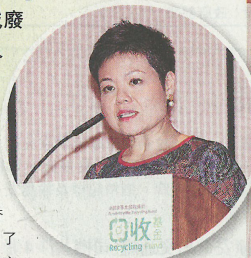
▲環境保護署副署長郭黃穎琦表示，政府會繼續支持本地回收業發展。

城市持續發展為市民帶來便利的生活，同時產生大量固體廢物。政府在2013年發表「香港資源循環藍圖2013-2022」，闡明要先通過資源再用、回收和再造，實行源頭減廢的全面策略，務求在2022年之前把都市固體廢物人均棄置量減少40%。要達至此目標，回收業的角色舉足輕重。