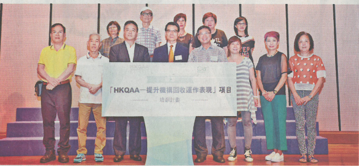
各得獎學員上台接受嘉許，表揚其學習成果。