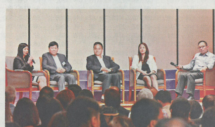
嘉許禮上還邀請了多位業界代表分享回收業的發展。