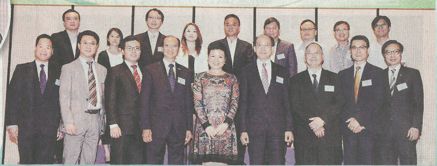
▲環保署副署長郭黃穎琦（前排，左五）、回收基金諮詢委員會主席郭振華，BBS, MH, 太平紳士（前排，右四）、環保署助理署長黃漢明（前排，右二）、香港品質保證局總裁林寶興博士（前排，左四）、「HKQAA - 提升回收業運作表現」項目指導委員會主席劉耀輝（前排，右三）、一眾項目指導委員會成員、回收基金諮詢委員會委員及演講嘉賓合照。