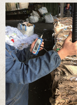
▲ 正進行廢紙水份檢測