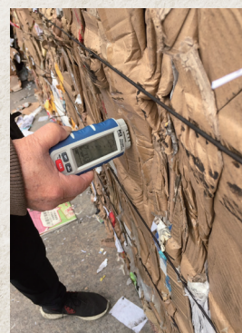
▲ 正進行廢紙水份檢測