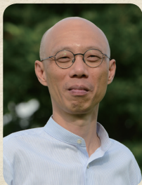
香港特別行政區政府 環境局局長